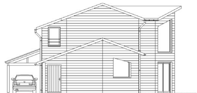
Façade latérale avec abri garage